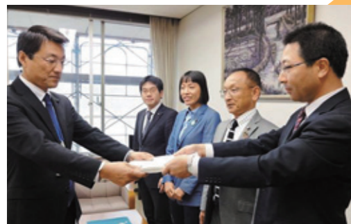
市民の会とともに、徹底究明を求める署名を提出

百条委員会とは? 地方自治法第100条に基づいてつくられる特別委員会。国会でいう証人喚問に該当。関係者から聞き取りをしたり、記録の提出を求めたりすることができる。