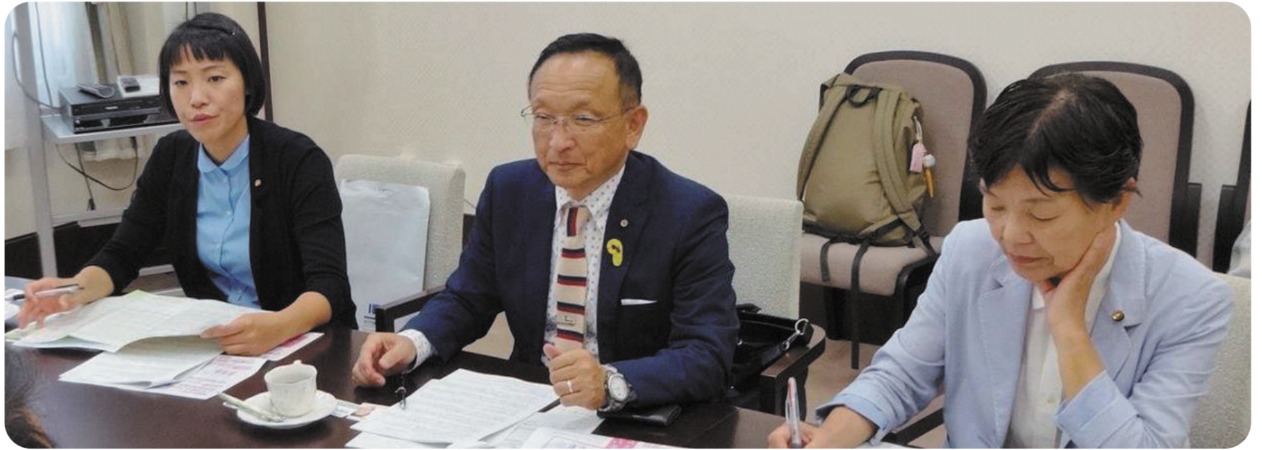
京都市へごみ有料化の視察に行き、説明を聴いているところ

新任期がはじまり、6月定例会議が行われました。安保法制について、戦災にあっていない本市として市長の見解をたずすとともに、消費増税や物価高で市民の暮らしが大変なとき、市議団3人一丸となって市民目線で奮闘しました!