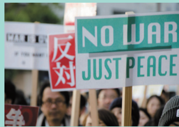
安保法制廃止のデモにも参加しています。