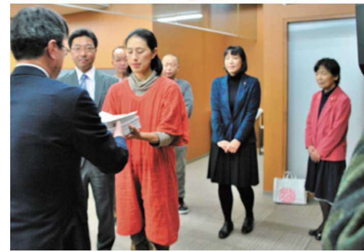
1月7日、市長に「ごみ有料化反対署名」3069筆を提出しました!

2016年の幕開け、新しい年を新たな希望や決意をもって、迎えられているのではないのでしょうか。金沢市はいよいよ、ゴミの有料化問題、64億円とも言われている南庁舎の建て替え問題が大詰めを迎え、激動の幕開けとなります。市民置き去りの市政には、これ以上私たちに負担をさせないで!というみなさんの声をしっかり受けとめて頑張ります。寒い季節柄、身体に充分気をつけて下さい。