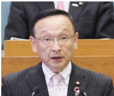
午後の3番目 代表質問です。