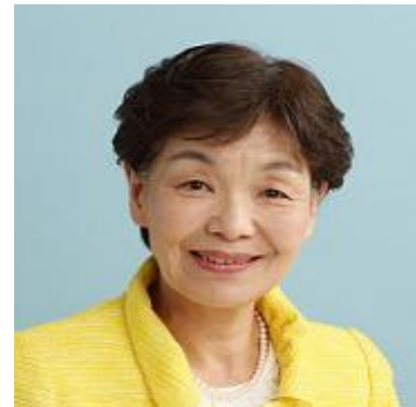
午前2番目に質問します。