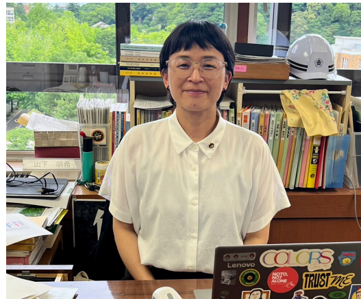
1期2年目もがんばります ✨ (市議員団控え室にて)