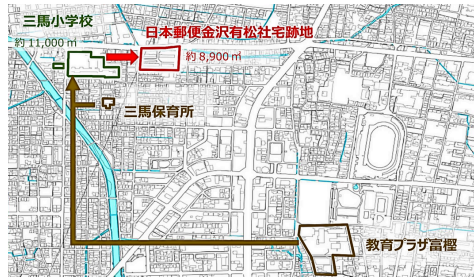
金沢市資料より 南部地区教育・福祉施設再整備基本構想

教育プラザ富樫は、市内全域から年間10万人を超える利用のある教育・福祉連携の拠点であることから、現場と市民の声をしっかり聞き進めていくことを求めます。