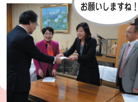
しっかりお願いしますね!

大雪が溶け、斜面が崩れた鈴見台の現場に急行。幸いケガ人なしでしたが、妊婦さんを含む4世帯が避難。市側曰く「想定外」。土砂災害警戒区域なのにパトロールしかされていない現状。早速、金沢市議員団として、早急な復旧対策と住民への説明、住民負担でなく公費とし、今後のパトロールや警報は雨だけでなく、雪についても行うよう、市長に申し入れました。