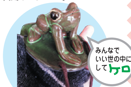
みんなでいい世の中にしてヘロ

子宮頸がん、ヒブ、肺炎球菌ワクチンの助成券が発行される他、学童保育の耐震化のための費用もつきました。