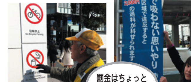
罰金はちょっとやりすぎかも〜

川崎・横浜はマナー条例先進都市で禁煙・禁駐輪の標識だらけ。注意でやめる人が多いので罰金徴収は少ないそう。競輪の場外車券売場は、街に出ずに駅の中で完結するシステム。医療・福祉相談が1ヶ所で解決する総合センターを見学。負担増となる国保料の旧ただし書き方式の検討会にも参加。等々有意義な視察でした。