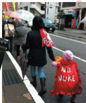
みんなで作った「未来をまもろう」

大震災から1年。「なくせ原発 3.11石川県集会」に参加しました。夫を福島に残し、子どもと避難したお母さんの辛い心境を聞き、胸がつかまります。パレードは、強風の中たくさんの人たちが「原発なくそう!」の想いをもち寄りました。