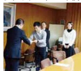
市長に国保の負担軽減を求めて申し入れ

加入世帯の4割にあたる2万4千世帯について、平均2万8千円/世帯の増加。徐々にあがる措置をとっていますが、2, 3年後には多額の保険料を支払わなくてはなりません。独自の控除など対応策を改めるべきです。