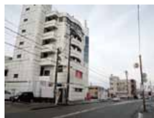
大徳地区場外車券売場候補ビル

議会としては「設置はふさわしくない」と採択してきましたし、住民のみなさんも署名を集めて反対を訴えてきました。議会軽視、住民おきざりの大変な事態です。わたしたち会派は、議会として調査特別委員会の設置を求めましたが、他会派は「必要ない」と。独自で経済産業省に事実確認に行ってきました。