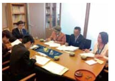
経済産業省で説明を受ける(4月15日)